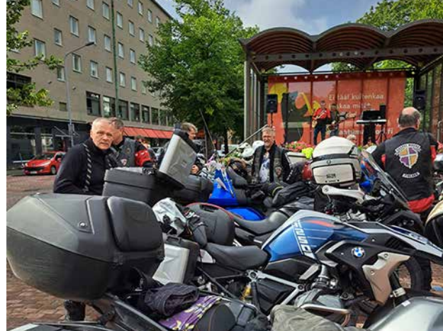
Valmiina, matka jatkuu...