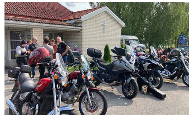
Kiireetön jutustelu, tuttujen tapaaminen ja uusiin tutustumisen makkaran ja kahvin kanssa — ne kuuluvat motoristikirkkoihin.