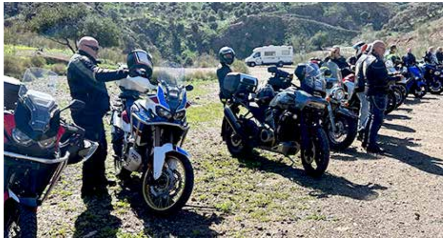
Gospel Riders luo ja vaalii yhteyttä

Meitä ihmisiä yhdistää monet asiat. Etenkin itsenäisyyspäivänä meitä yhdistää suomalaisuus. Erityisesti ulkomailla, kohdattaessa toisia suomalaisia, koetaan helposti yhteen kuuluvuutta.