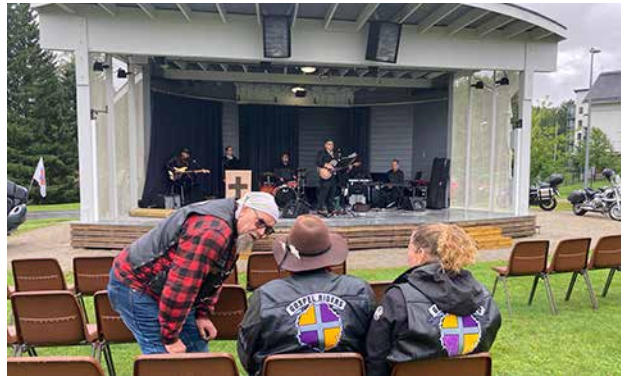
Tuolirivit olivat suurimmaksi osaksi tyhjiä, kun osanottajat pitivät sadetta makkara- ja kahvikojulla.

berginpuistoon tullessa, siellä ollessa ja hieman vielä pois lähtiessäkin. Se tarkoitti, että moni motoristi jäi tulematta ja vaille tilaisuuden mainiota antia. Pyöriä pujotelti paikalle lopulta vain seitsemän. Iloksemme yksi oli juuri harrastuksen aloittanut ja pyörän hankkinut nuorimies. Kaikkiaan paikalla oli useampi kymmenen kuulijaa ja talkoolaista.