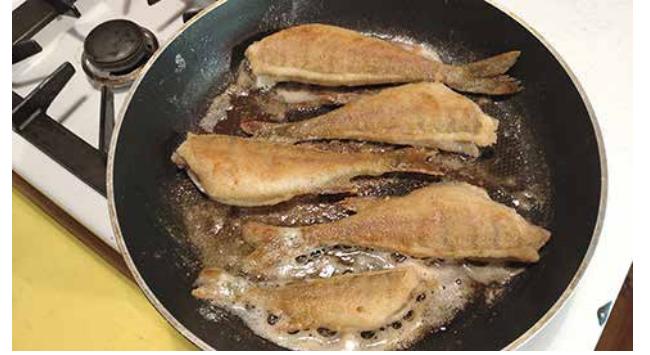
Herkutella voi muullakin kuin makkaralla. Herkullinen kalasaalis tarjoiluvalmiiksi luonnon keskellä