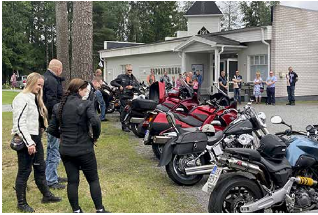
Moottoripyöriä Sastamalan vapiksen motoristikirkkoon kokoontui hieman viimevuotista enemmän.

Vettä ripeksi vaihtelevasti Saarijärven Rune-