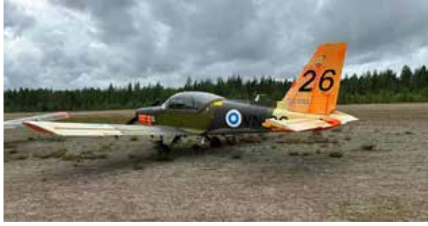
Lentokone. Kymin lentokentällä huhtikuussa olleessa lentonäytöksessä omalla osastolla kertomassa toiminnasta seurakunta, Gospel Riders ja lähetysjärjestö MAF lähetyslentäjät. (Saarisen Mikkan työmaa).