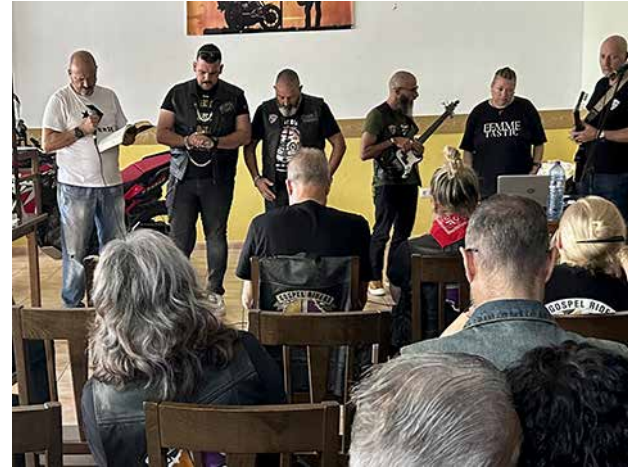
Iltaohjelmassa oli rukousta ja musiikkia.

Presidenttien kokouksissa pohdittiin kerhon tulevaisuudennäkymiä. Radikaaleja ehdotuksia tehtiin, mutta sopuisasti päätettiin jat-