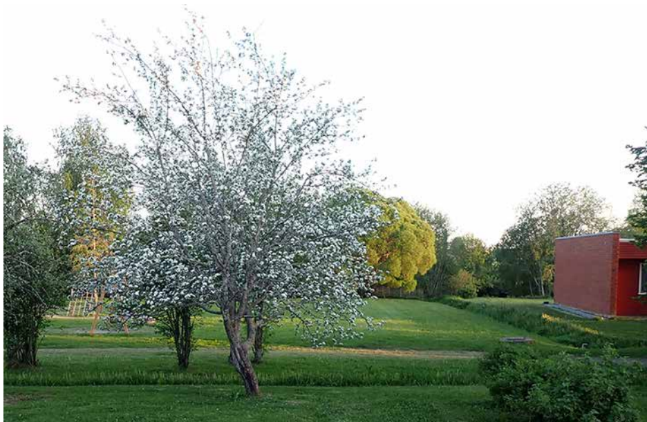
Omenapuuni keväisessä juhla-asussa, muutama kuukausi ennen pyöreitä hedelmiä

"Toinen toisenne kunnioittamisessa kilpaillaa keskenämme." Room. 12:10 "Lempeä vastaus taltuttaa kiukun, mutta loukkaava sana nostaa vihan." Sananl. 15:1 "Totuta poikanen tiensä suuntaan, niin hän ei vanhetessaankaan siltä poikkeaa." Sananl. 22:6 "Isät kurittivat meitä vain muutamia päiviä varten, niin kuin he näkivät hyväksi, mutta Jumala kurittaa meitä tosi parhaaksemme, että pääsisimme osallisiksi hänen pyhydestään. Mikään kuritus ei tosin sillä kertaa näytä olevan iloksi vaan murheeksi, mutta jälkeinpäin se antaa hedelmänään vanhurskauden ja rauhan niille, joita on sen avulla harjoitettu." Hepr. 12:10-11