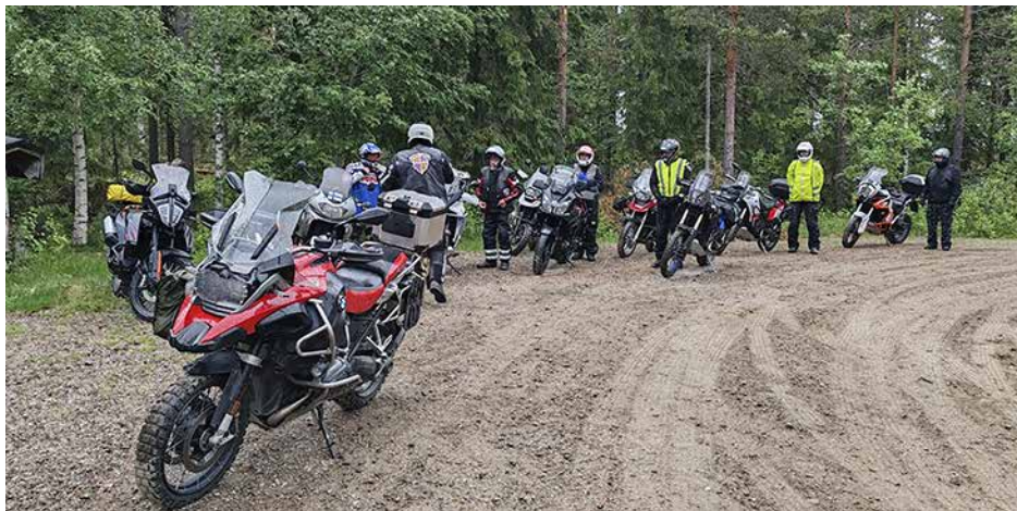
Ryhmän tauko kodalla

erityisen vaikeaa nykyaikaisilla moottoripyörillä, kunhan olosuhteet ovat suotuisat. Ongelmat alkavat syntyä, kun liikenne ruuhkautuu tai olosuhteet muuttuvat