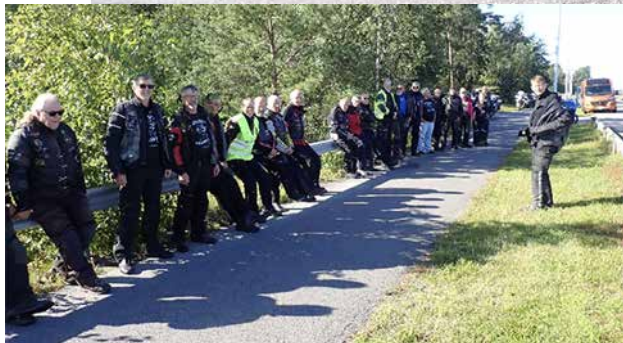
Vaasan satamassa 11.8.24

Kanat orrella kuuntelemassa tottelevaisina johtajan ohjeistusta ja rukoilemassa Uudenkaupungin satamassa