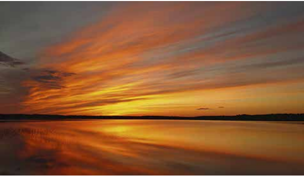
Luojamme luontoa kauniissa väreissä