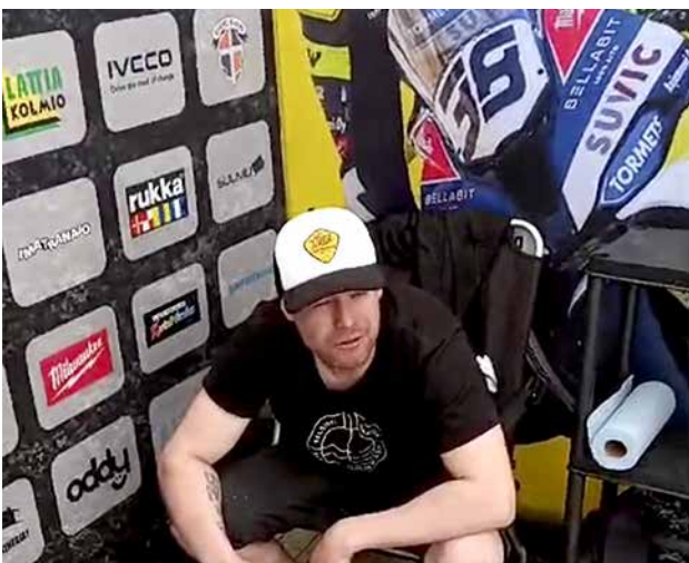
Erno yhteistyökumppaneiden logojen edessä. Hän antaa itselleen koko kaudesta arvosanaksi 8+