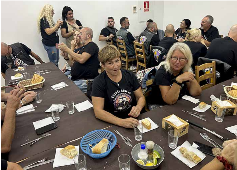
Yhteinen illallinen suomalaisten ja espanjalaisten kanssa.

Mukana oli jäseniä kaikista chaptereista (Malaga, Vinaros, Cadiz) yhteensä noin 30 henkilöä.