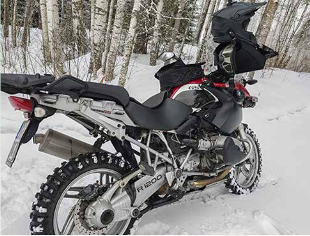
Turvallista kesän odotusta talviajojen lomassa

vain noin 5% jäsenistämme osallistui neljään järjestettyyn ajokoulutuskurssiimme. Tarjolla oli kaksi kurssia ennakkoivasta ajotavasta sekä kaksi kurssia sepeli-,