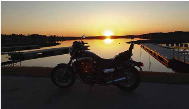
Motoristin pyörämyös illan tunnelmissa