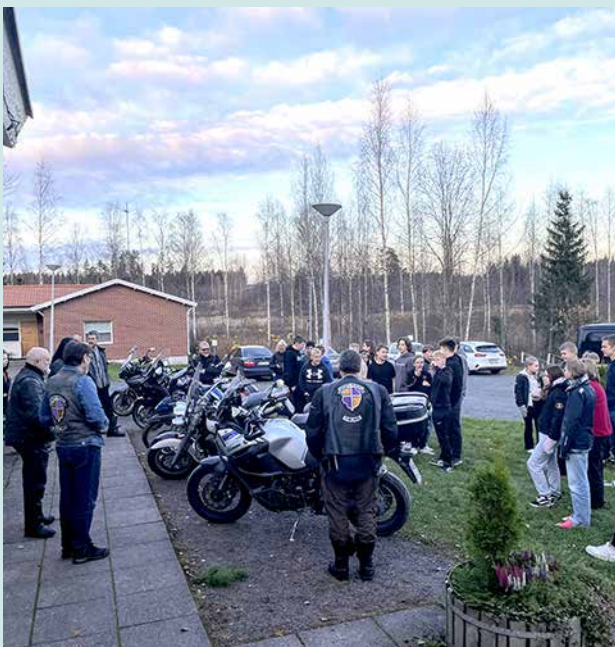
Riparivierailut on osa gospelridersien toimintaa

Saavuimme paikalle niin, että ehdimme vielä syödä riparilaisten kanssa. Ruokailun jälkeen siirryimme ulos ihmettelemään ajopelejä. Vain muutama nuori uskaltautui istumaan pyörrien päällä, mutta heistä