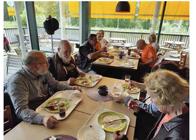
Kuvassa hallituksen EMC-26 palaveri Keuruulla. Kerhomme päätapahtuma kesällä on MOJ. Viimekesänä yhteistä viikonloppua vietettiin Hupelissa Kuopion alueella. Tänä vuonna tapahtuma on heinäkuussa Satakunnan alueella Kankaanpäässä.

Moottoripyörät herättävät usein kysymyksiä. Mitä kulkee? Onko tehoi?