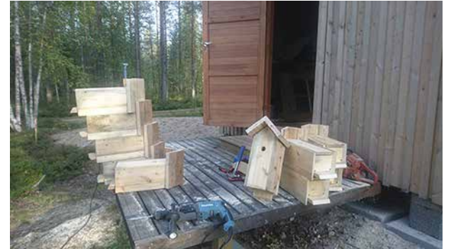
Motoristin sydän on lähellä luontoa. Hyvä harrastus, linnun pönttöjä jäämä materiaaleista